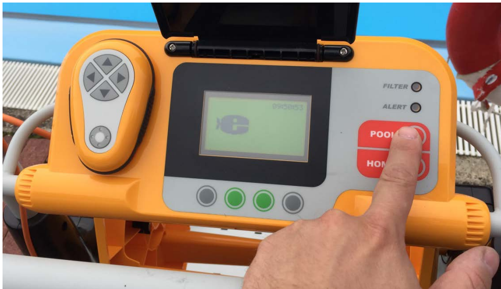
Abbildung 21: Bedienfeld