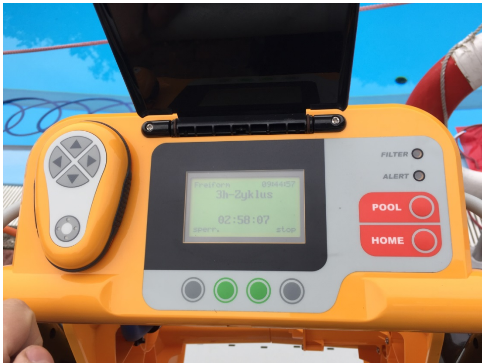
Abbildung 9: Bedienfeld Automatikbetrieb

Anzeige nach einschalten des Automatikbetriebs