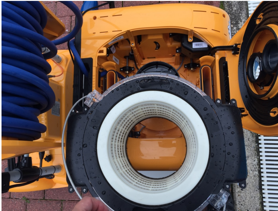
Abbildung 15: Position Grobfilter im Gerät

Die Lage des Filters im Gerät ist variabel.