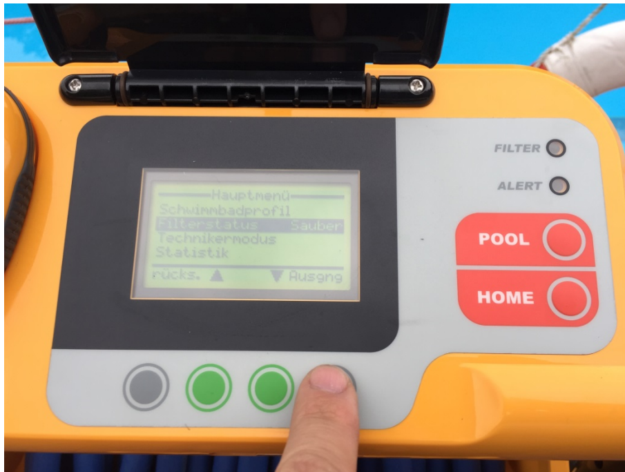
Abbildung 19: Bedienfeld

Jetzt kann das Gerät am Hauptschalter wieder ausgeschaltet werden.