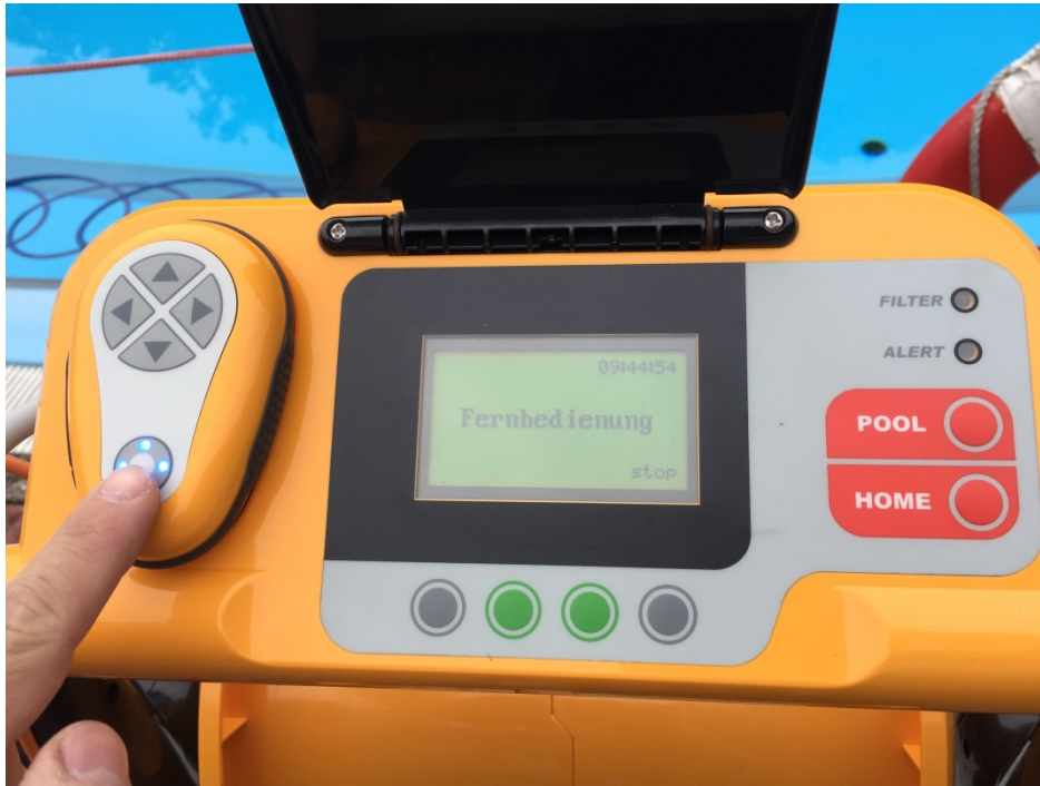
Abbildung 8: Handbetrieb EIN

Wenn sich das Gerät in der Startposition befindet, muss es wieder in Automatik geschaltet werden. Dies geschieht automatisch nach 5 Minuten ohne Steuerungsbefehl oder durch gedrückt halten der runden Taste (solange drücken bis die blauen Lampen ausgehen).