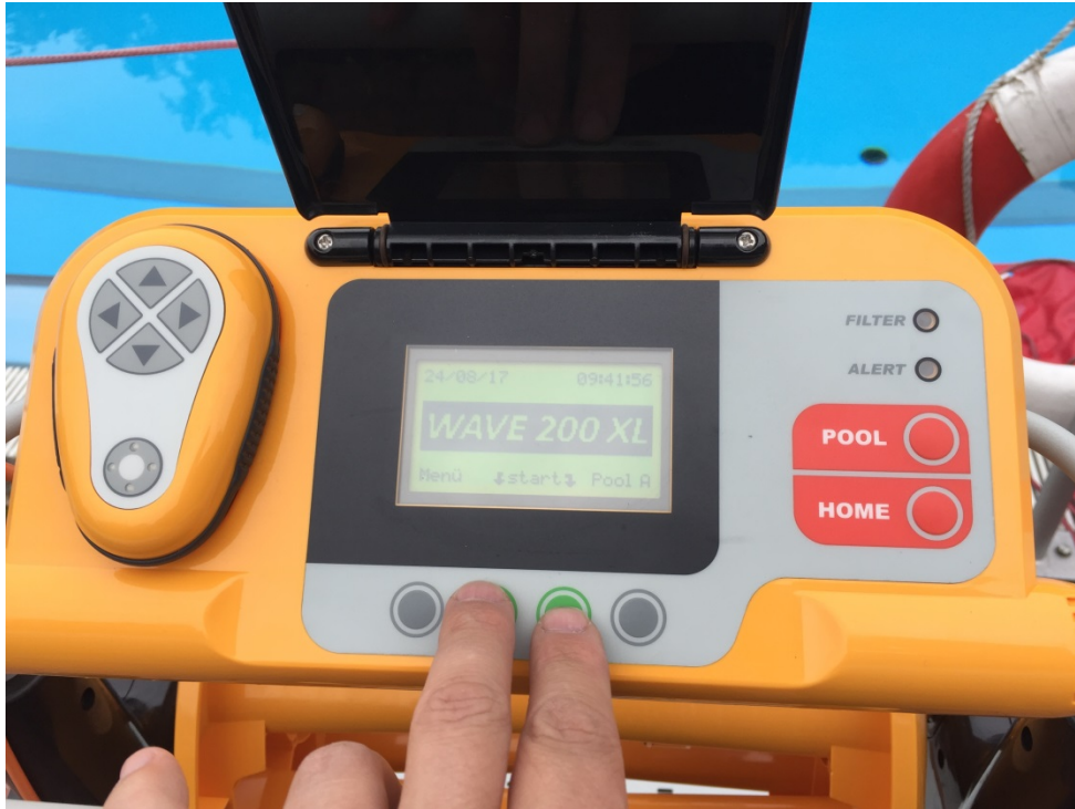
Abbildung 4: Bedienfeld

Zum starten des Gerätes müssen beide grünen Tasten gleichzeitig gedrückt werden.