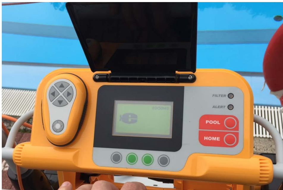
Abbildung 20: Bildschirmschoner

Nach einiger Zeit sperrt sich das Bedienfeld und auf dem Display wird ein Bildschirmschoner angezeigt. Dies kann durch Drücken folgender Tasten entsperrt/ aufgehoben werden.