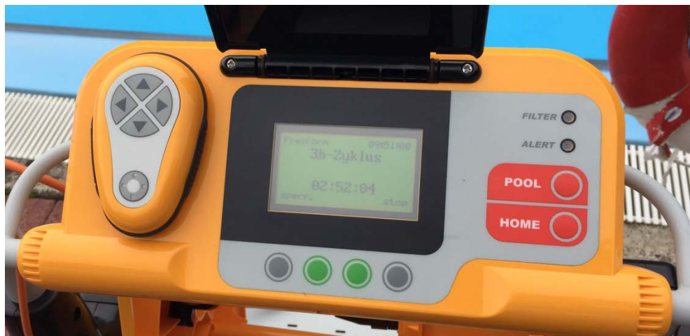
Abbildung 23: Bedienfeld Automatik