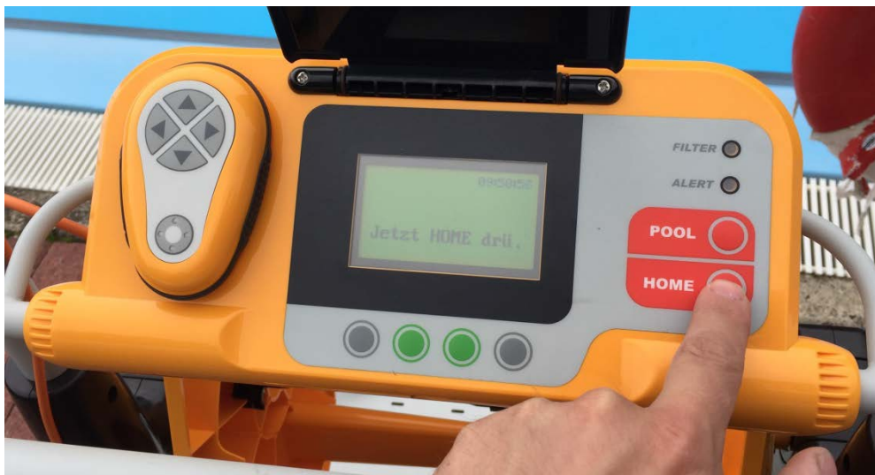
Abbildung 22: Bedienfeld