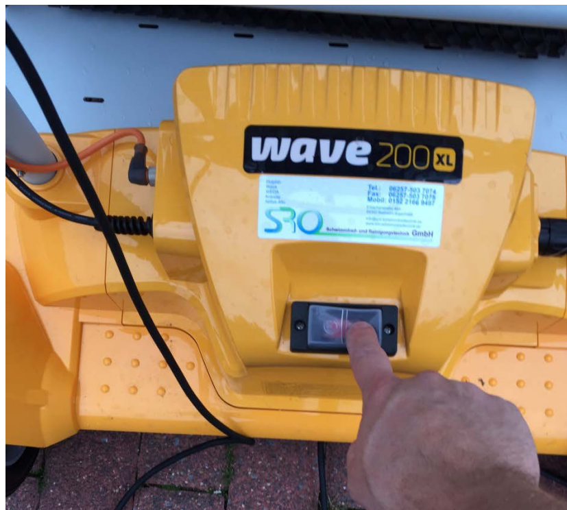
Abbildung 1: Hauptschalter