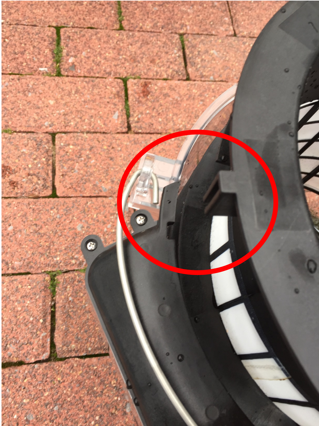
Abbildung 14: Positionierhilfe Grobfilter

Nach dem die Filter gereinigt wurden müssen diese in wieder im Gerät eingesetzt werden. Hierbei muss auf die korrekte Lage des Grobfilters geachtet werden.