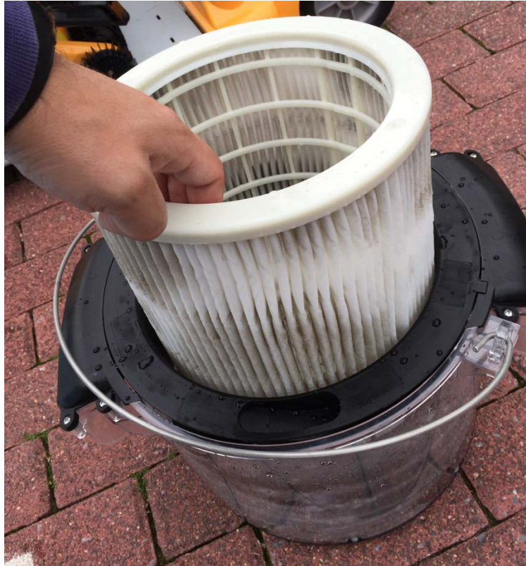
Abbildung 12: Feinfilter

Nun kann der Eimer mit den Filtern entnommen werden und die Filter können gereinigt werden. Alle Filter und der Eimer müssen unter fließendem Wasser ausgewaschen werden.