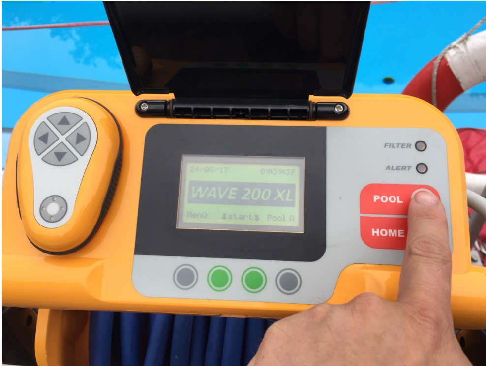
Abbildung 2: Bedienfeld

Um das Gerät in das Becken zu fahren muss die Taste „POOL“ gedrückt werden. Das Gerät fährt nun selbstständig vom Transportwagen ins Becken und taucht ab.