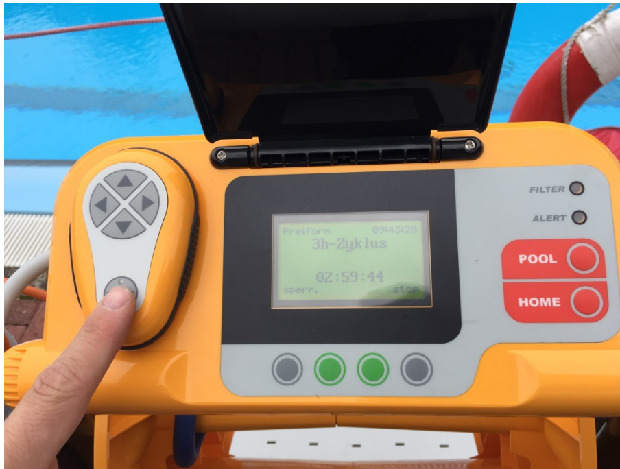
Abbildung 7: Fernbedienung

Nach abgeschlossener Kalibrierung beginnt das Gerät automatisch mit der Reinigung. Da wir das Gerät an der Startposition positionieren wollen, müssen wir das Gerät in Handbetrieb schalten. Dazu muss auf der Fernbedienung die runde Taste gedrückt werden. Bei aktivem Handbetrieb leuchtet diese dann blau. Nun kann mit den Pfeiltasten das Gerät verfahren werden.