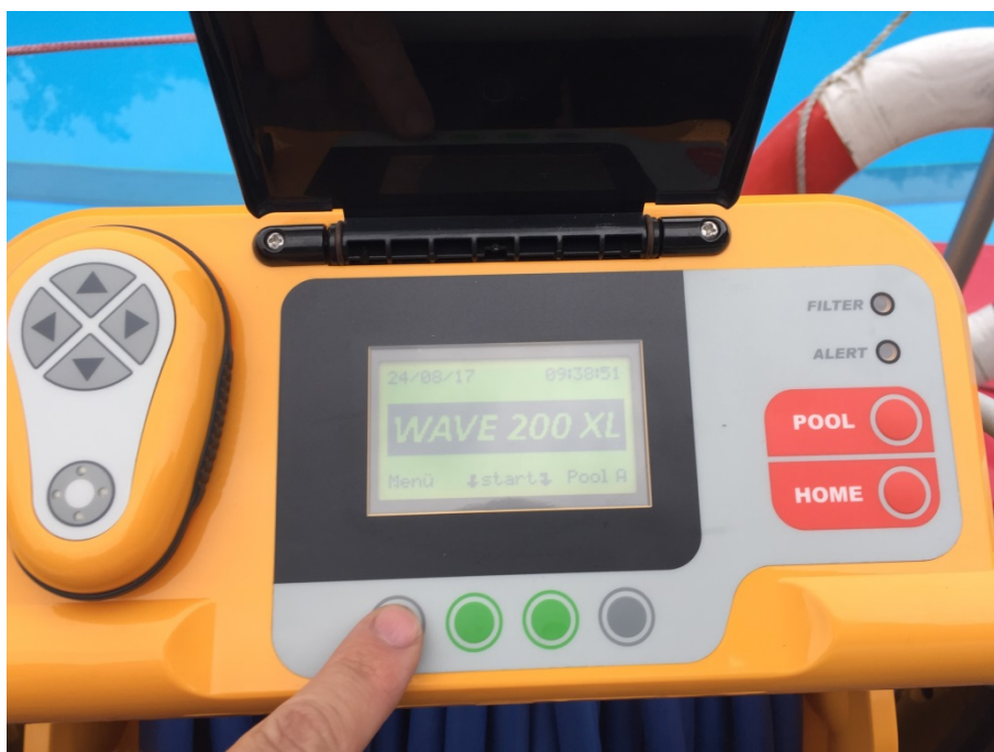
Abbildung 16: Bedienfeld

Nach dem der Filter wieder im Gerät eingebaut und die Abdeckung geschlossen wurde, muss der Filterstatus zurückgesetzt werden. Hierzu muss das Gerät wieder eingeschaltet werden. Nach dem auf dem Display der Grundbildschirm erscheint, muss die linke graue Taste „Menü“ gedrückt werden.