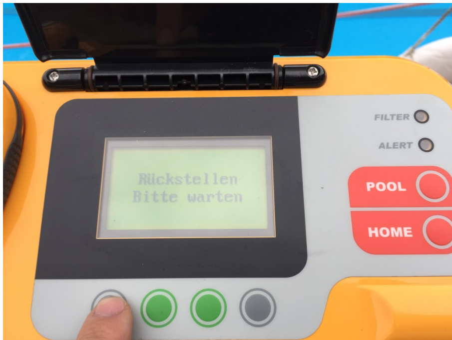
Abbildung 18: Bedienfeld

Nun die linke graue Taste „rücks.“ drücken. Jetzt wird der Filterstatus auf sauber zurückgesetzt.