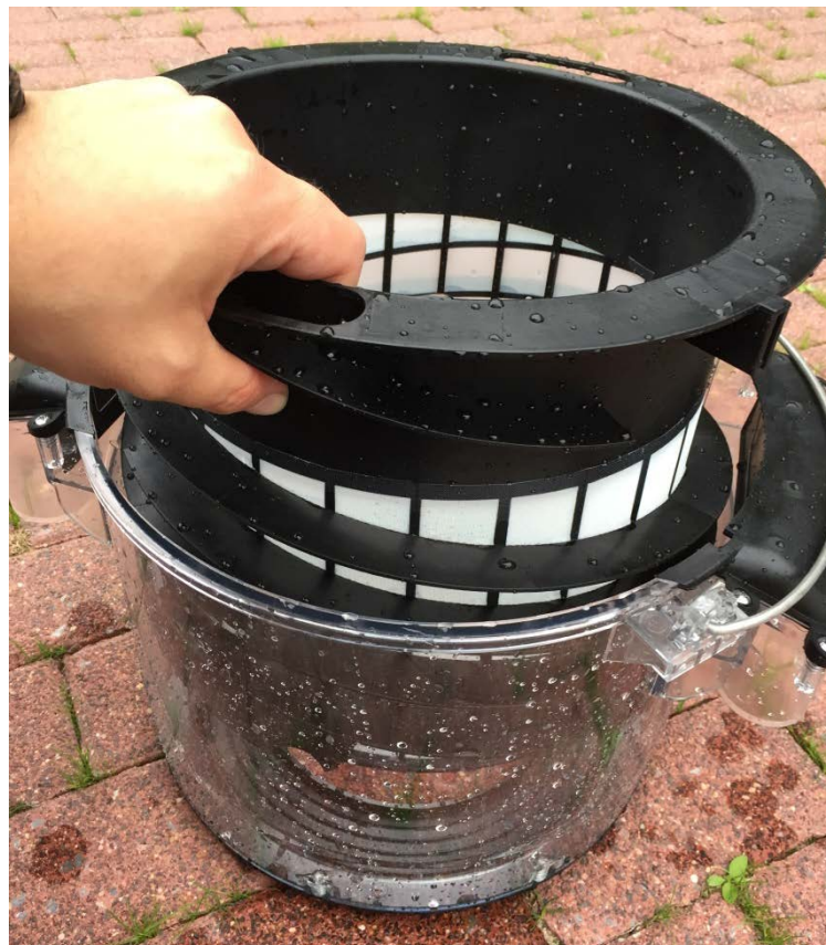
Abbildung 13: Grobfilter