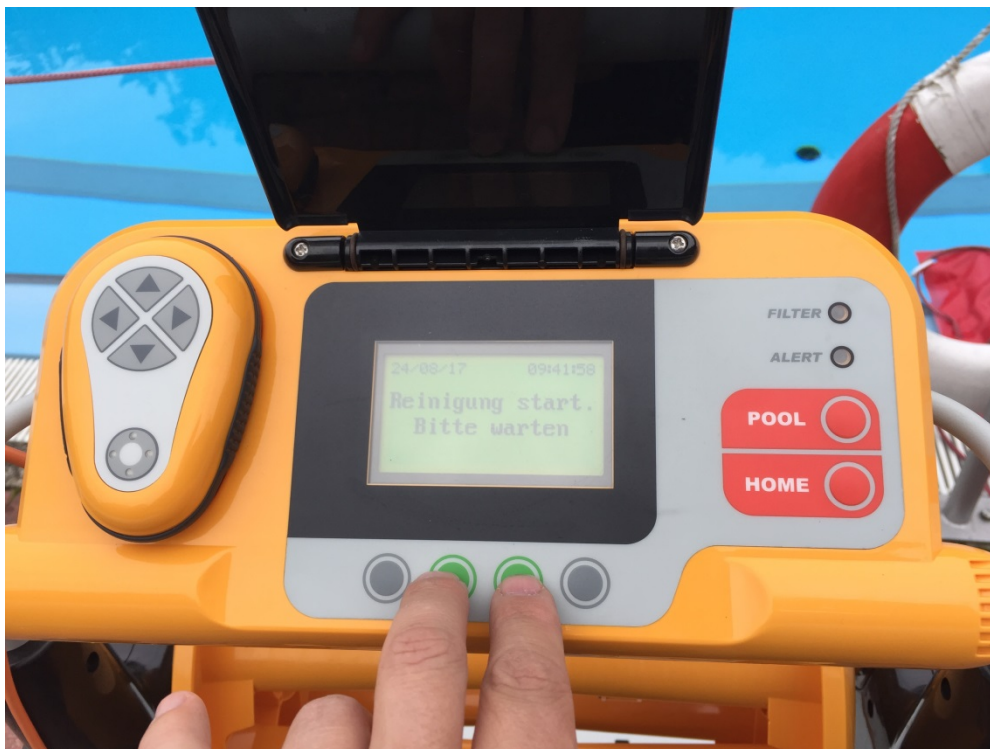
Abbildung 5: Bedienfeld

Nun startet die Kalibrierung und anschließend das Reinigungsprogramm.