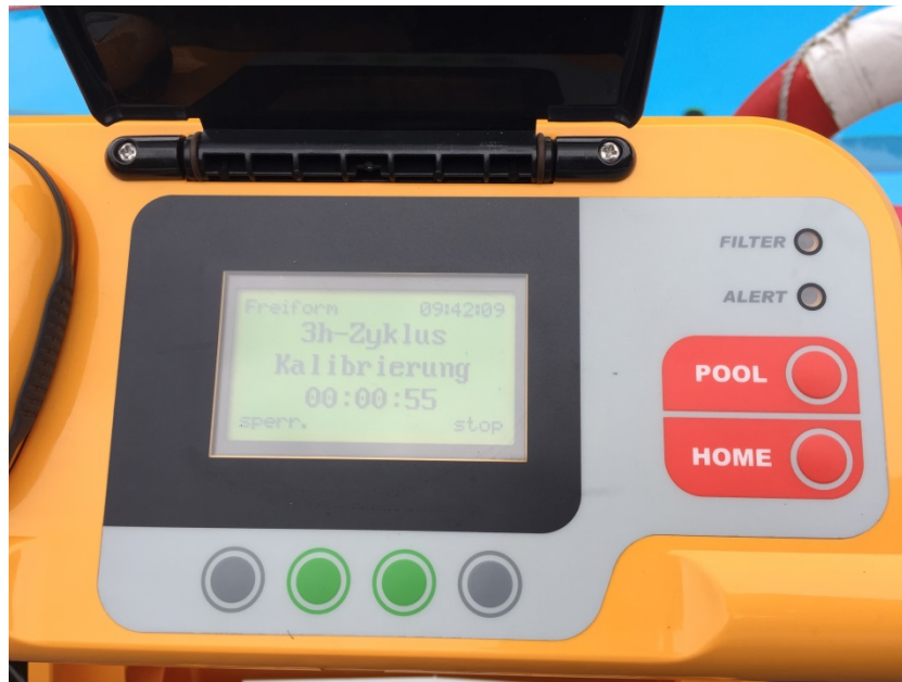
Abbildung 6: Bedienfeld

Während der Kalibrierung darf das Gerät nicht bewegt werden!