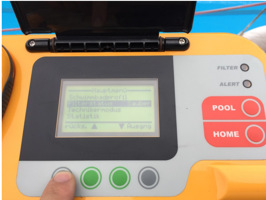
Abbildung 17: Bedienfeld

Danach muss mit der rechten grünen Taste der Menüpunkt „Filterstatus“ ausgewählt werden.