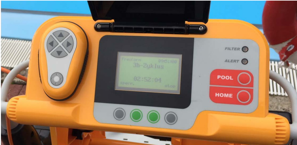
Abbildung 10: Bedienfeld

Dann muss die rechte graue Taste „stop“ gedrückt werden.